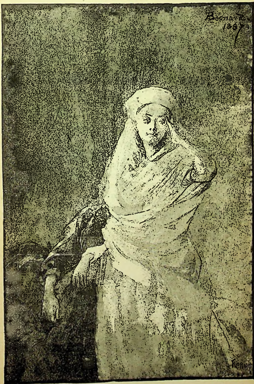
Phase de la matérialisation d'un Esprit.