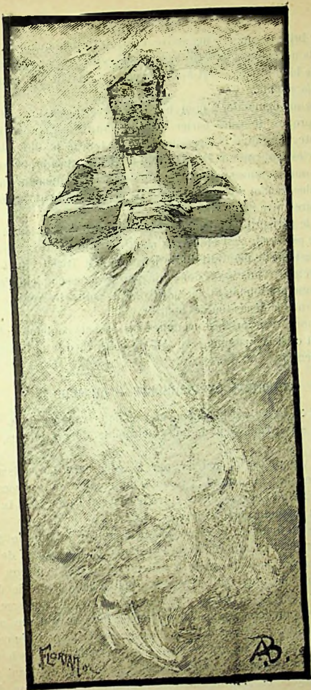
Phase de la matérialisation d'un Esprit.