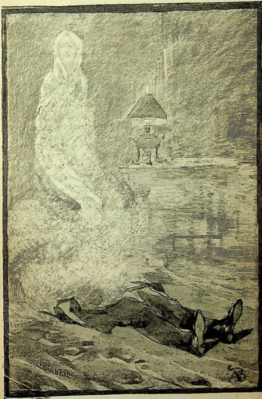
Phase de la matérialisation d'un Esprit.