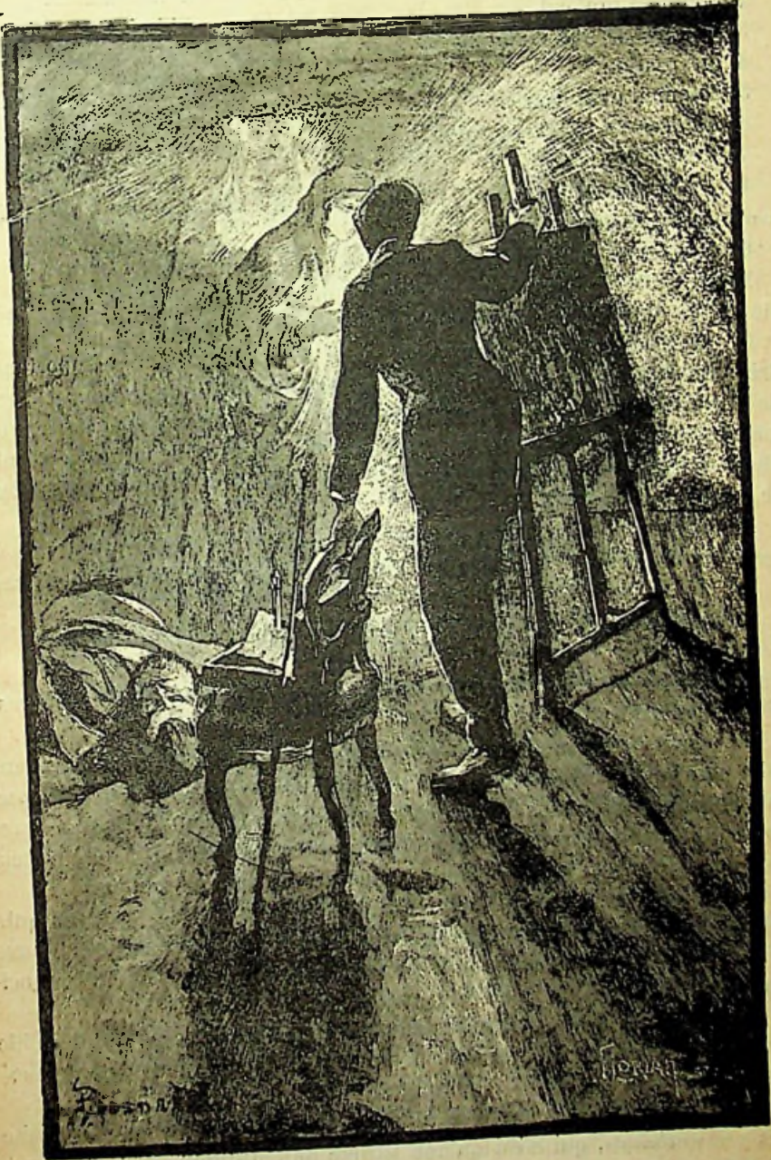
Phase de la matérialisation d'un Esprit.